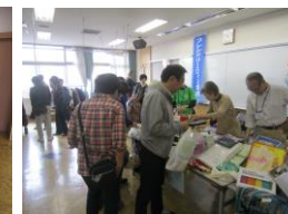
千客万来の大盛況