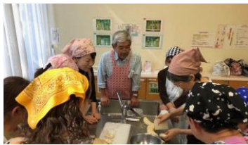
若山さんの毎回楽しみな手づくり教室