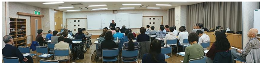
楽しい講演を熱心に読み取り